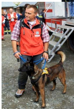
Diverse organizzazioni hanno partecipato all'esercitazione presso la malga di Freistriz tra cui p.e. il soccorso alpino austriaco ed italiano con le unità cinofili e la Croce Rossa austriaca.

Già nel novembre del 2006 è stata riscontrata la necessità di una collaborazione tra le due Regioni contermini Friuli Venezia Giulia e Carinzia nel settore della Protezione Civile. Con l'assistenza tecnica della sottosezione sicurezza della Giunta regionale della Carinzia è stata predisposta e firmata dai due assessori competenti delle due regioni una DICHIARAZIONE D'INTENTI TRA LA REGIONE FRIULI VENEZIA GIULIA E CARINZIA SULLA COOPERAZIONE TRANSFRONTALIERA NEL CAMPO DELLA PROTEZIONE CIVILE.