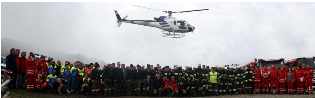
Rappresentanti delle organizzazioni partecipanti, collaboratori dell'Ufficio della Giunta Regionale della Carinzia e dei Comuni partner

dai gruppi comunali di Resia, Pontebba, Amaro, Tolmezzo, Osoppo, Gemona, Trasaghis, Forgaria, Tarvisio e Moggio Udinese, volontari del Corpo Nazionale Soccorso Alpino e Speleologico, personale del Corpo Forestale Regionale e del Corpo Forestale dello Stato, unità cinofile della Protezione Civile della Regione e della Guardia di Finanza. In particolare nello scenario del incendio boschivo è risultato fondamentale l'intervento dell'elicottero del Servizio aereo regionale in capo alla Protezione Civile della Regione Autonoma Friuli Venezia Giulia.